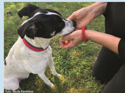
Sobald der Hund zur leeren Hand schaut oder diese sogar berührt, wird geklickt und er bekommt das Futter aus der Futterhand herübergereicht.