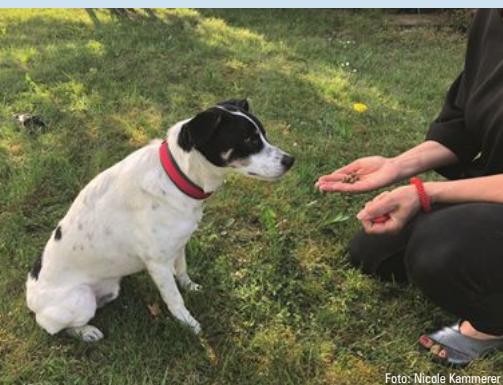
Präsentieren Sie dem Hund eine gefüllte Hand und eine Hand, in der nichts außer dem Clicker ist.

und Ihre beiden geschlossenen Fäuste abschnüffeln. Sobald der Vierbeiner seine Schnauze in Richtung Clickerhand bewegt oder mit der Nase anstupst, bestätigen Sie mit dem Clicker und führen die Futterhand an den Clicker. Dort bekommt der Hund sein Futter.