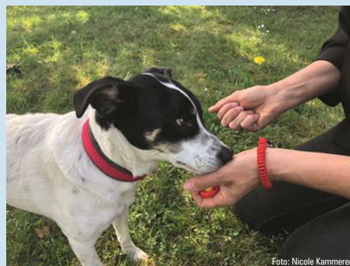
Der Hund soll lernen, zur leeren Hand zu schauen bzw. diese später zu berühren.